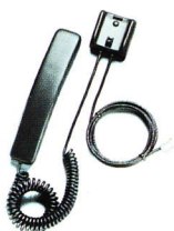
HSU-1 Zusatz-Hörer für Car Kit

Zum Lieferumfang des CARK111 gehört noch das Kabel-Set PCH-4J (ohne Abbildung).