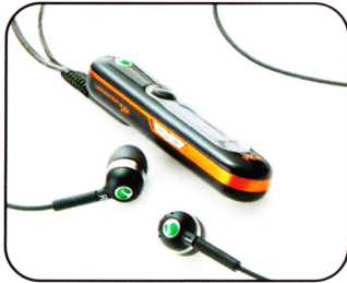
Stereo Bluetooth™ Headset HBH-DS970