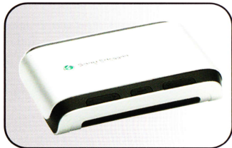
Bluetooth™ Media Center MMV-200