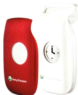
Velvet Blue & zusätzliches silbernes Frontcover

Mach dein individuelles Statement – kein Problem mit den 3 verschiedenen Style-Up™ Cover-Sets mit je 3 neuen, aufregenden Motiven.