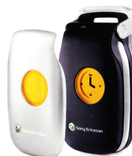
Frosty White & zusätzliches rotes Frontcover